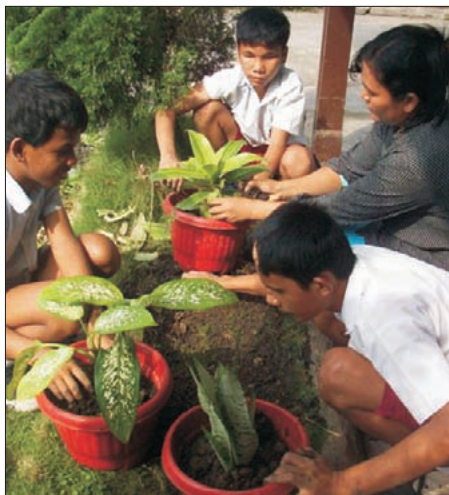
Die blinden Schüler beim Blumen umpflanzen.

Von seinen blinden Mitschülern, den blinden und sehenden Mitarbeitenden und Besuchern der Schule wird ihm Anerkennung und Bewunderung entgegengebracht für diese Leistung.