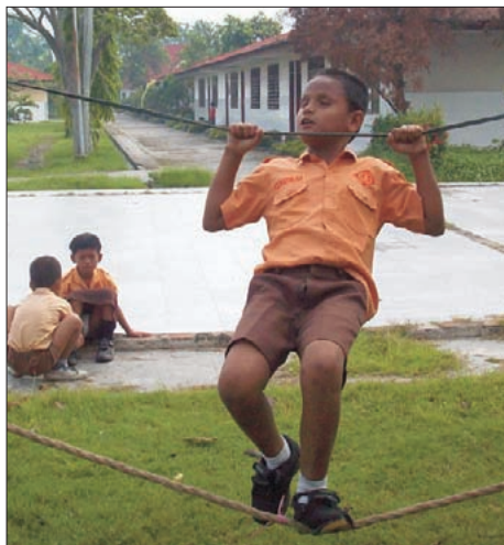
Alberki lernt auf dem Seil zu balancieren.