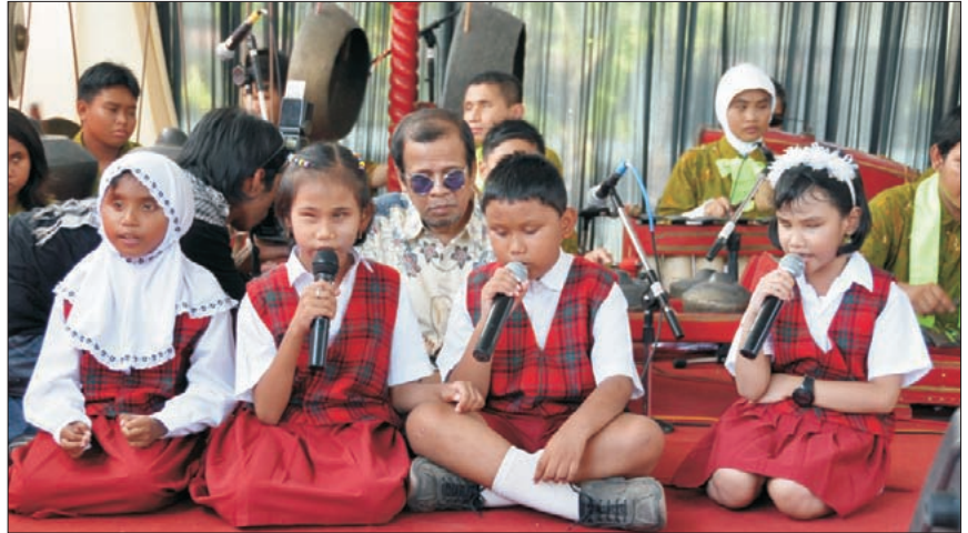
Die blinden Kinder bereichern die Feier durch Musik und Gesang.

Die HBM unterstützt die Schule seit 30 Jahren durch Patenschaften. Mit einer Patenschaft werden die Verpflegung, Unterbringung, Krankenkosten und